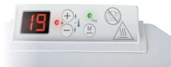
Vyhovuje evropské ekodesign směrnici ERP 2018