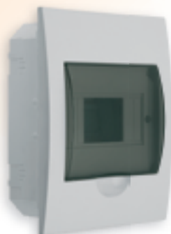
■ DB106F 1X6P/FMD