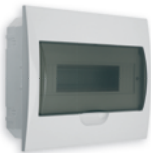
■ DB112F 1X12P/FMD