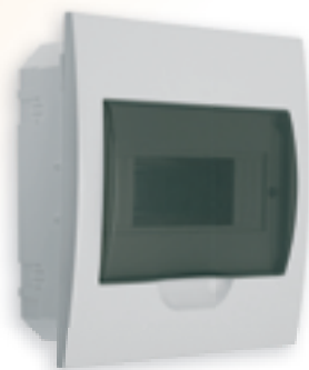
■ DB108F 1X8P/FMD