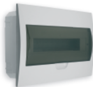
■ DB118F 1X18P/FMD