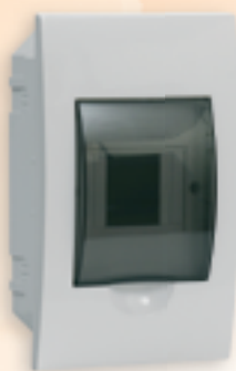
■ DB104F 1X4P/FMD