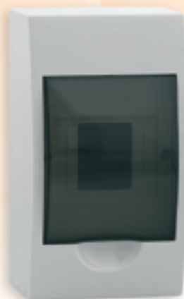
■ DB104S 1X4P/SMD