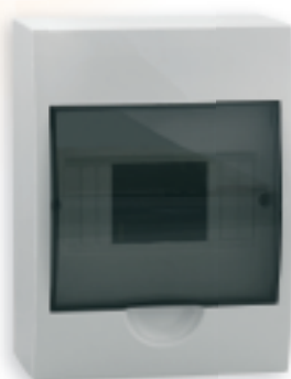
■ DB106S 1X6P/SMD