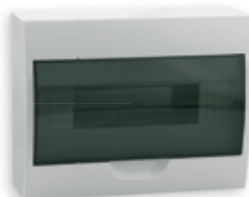
■ DB108S 1X8P/SMD