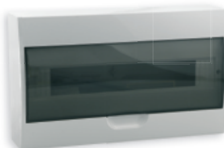
■ DB118S 1X18P/SMD