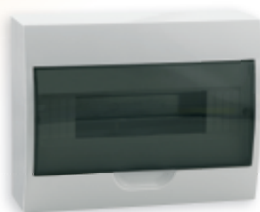
■ DB112S 1X12P/SMD